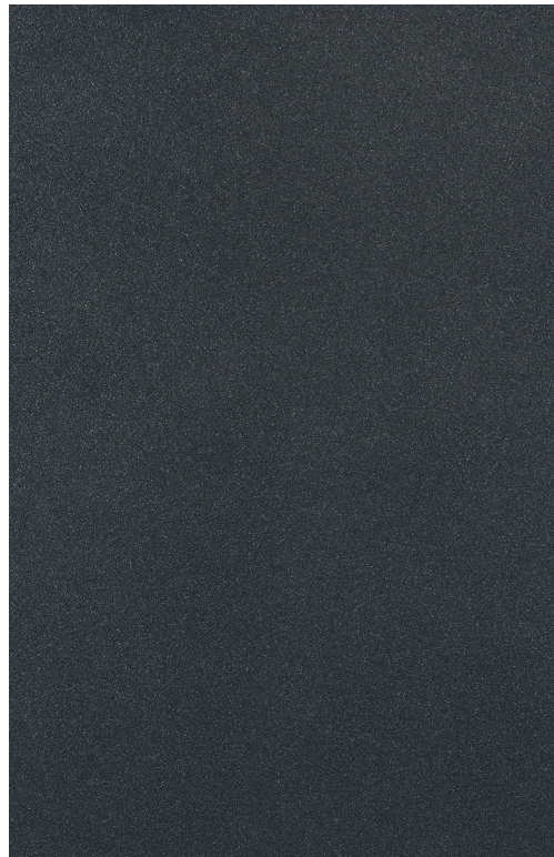
Pulverbeschichtung Feinstruktur Farbton S703 „Eisenglimmer“