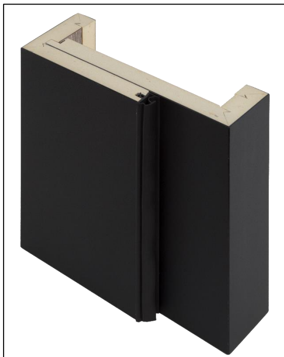
Bild 3: Die aus nässeunempfindlichem, holz- und holzwerkstofffreiem Material bestehende Zarge hält direkter und lang anhaltender Nässe dauerhaft stand und gleicht optisch einer Holzumfassungszarge.