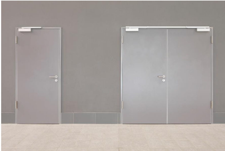
Bild 2: Die neue Schörghuber Nassraumzarge ist mit 1- und 2-flügeligen Türblättern kombinierbar und mit verschiedenen HPL-Schichtstoffen erhältlich.