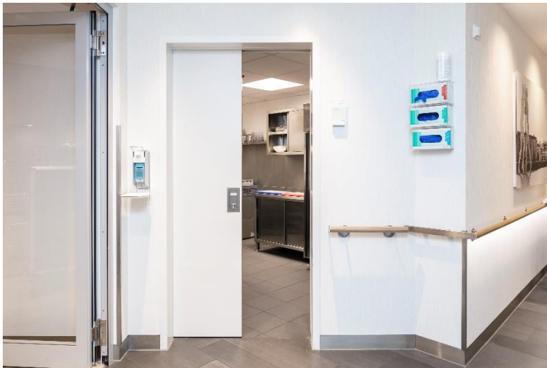
Bild 2: Abhängig von der bauseitigen Anforderung können die Cleanroom Tür-Varianten von Schörghuber miteinander kombiniert werden. Es stehen verschiedene Oberflächen und Bauteile zur Auswahl, wie etwa die widerstandsfähige HPL Oberfläche „Cleanroom white“, eine robuste und stoßfeste PU-Kante, ein vierseitig umlaufender Kantenschutz oder Beschläge aus Edelstahl.