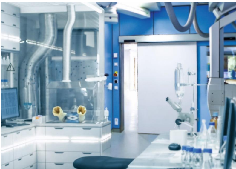
Bild 4: Hohe Hygienestandards müssen auch in Forschungs- und Gesundheitseinrichtungen eingehalten werden. Die Schörghuber Cleanroom Türen erfüllen die hier notwendigen Anforderungen.

Bild 3: Alle Varianten der Schörghuber Cleanroom Türen sind durch das Fraunhofer Institut IPA nachweislich auf ihre hohen Hygieneleistungen geprüft und zertifiziert.